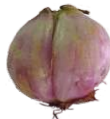
Deformado: O que apresenta formato diferente do típico do cultivar, incluindo crescimentos secundários, ou seja, bulbos unidos pelo talo, apresentando externamente catáfilos envoltivos.