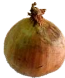
Dano Mecânico: Lesão de origem mecânica observada nos catáfilos do bulbo.