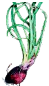
Brotado: Quando apresenta emissão de broto visível acima do colo do bulbo.