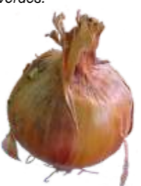
Falta de Turgescência (Flacidez): Ausência de rigidez normal do bulbo.