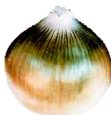
Descoloração: Desvio parcial ou total na cor característica do cultivar, incluindo o esverdeamento, ou seja, bulbo com catáfilos externos verdes.