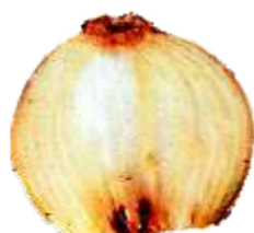
Podridão: Dano patológico que implique em qualquer grau de decomposição, desintegração ou fermentação dos tecidos.