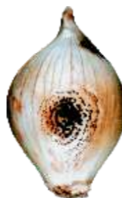
Mancha Negra (Carvão): Área enegrecida em virtude do ataque de fungos nos catáfilos externos.