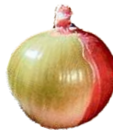
Falta de Catáfilos (películas): É o bulbo que apresenta mais de 30% de sua superfície desprovida de catáfilos envoltivos.