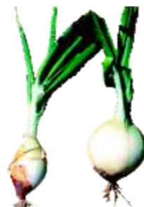
Talo Grosso: Quando a união dos catáfilos do colo do bulbo apresentam uma abertura maior que a normal, devido a um alongamento do talo pelo interior do mesmo.