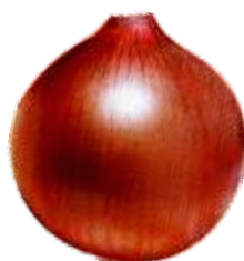
Vermelha, Pinhão ou Baia